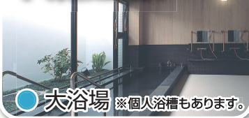
● 大浴場 ※個人浴槽もあります。